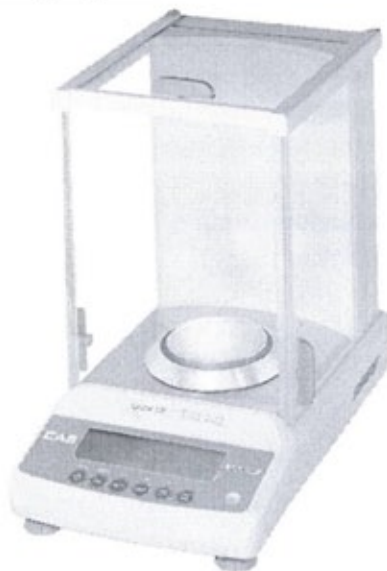
Рисунок 1 – Общий вид весов САУ

Общий вид весов представлен на рисунке 1.