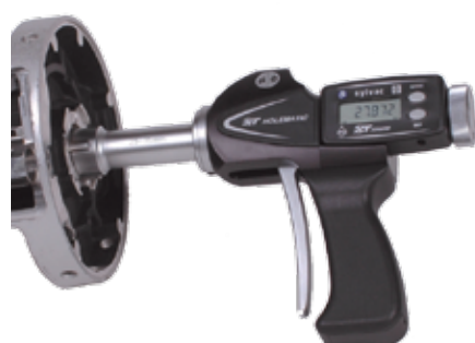
Измерительная система пистолетного типа