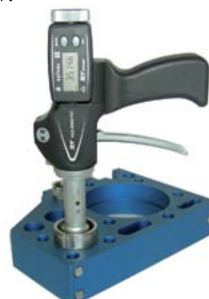
Измерение диаметра с системой XTH